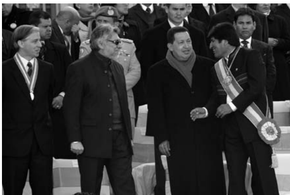
De derecha a izquierda: Evo Morales, presidente de Bolivia; Hugo Chávez, presidente de Venezuela; Fernando Lugo, presidente de Paraguay y Álvaro García Linera, vicepresidente de Bolivia. En los festejos de la conmemoración de los doscientos años de la gesta libertaria en La Paz.

La pretensión de implantar este modelo político en América Latina se encuentra reseñada en