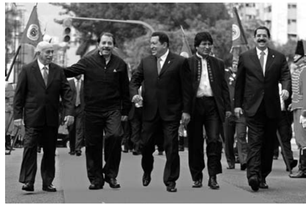
De izquierda a derecha, el vice-presidente cubano José Ramón Machado, los presidentes Daniel Ortega de Nicaragua, Hugo Chávez de Venezuela, Evo Morales de Bolivia y Manuel Zelaya de Honduras. Cumbre del ALBA del 2 de febrero de 2009.

3. Una fuerte campaña mediática de propaganda e ideologización, a favor del modelo