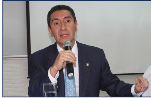
Ministro de Seguridad René Figueroa

Se trataron los actuales problemas que tiene El Salvador: la polarización política, las pandillas o maras, el delito organizado y la inmigración ilegal, entre otras cosas. A continuación se analizaron las lecciones aprendidas con