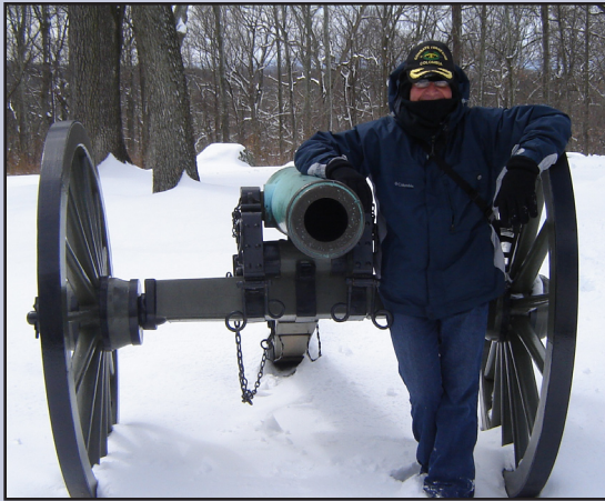
El General Carlos Ospina inspecciona otro campo de batalla para la libertad—Gettysburg, Pennsylvania.