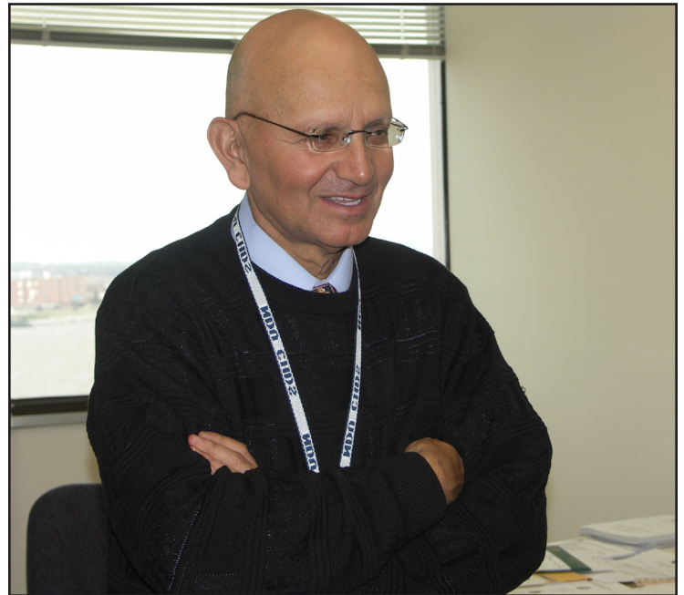
General Carlos Ospina Ovalle

Ospina es también un fuerte defensor de la libertad de prensa. “Sin prensa libre no puede haber