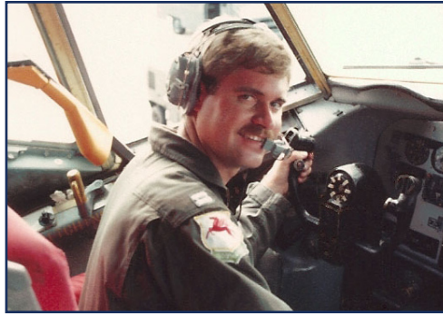
Siguiendo los pasos de su padre, Johnson obtuvo su licencia de piloto mientras que estaba en la escuela secundaria y luego se desempeñó como piloto y agregado aéreo en la Fuerza Aérea de los Estados Unidos de América. Aquí se encuentra él en los controles de un KC-135 Stratotanker, estación de servicio aérea venerable de la Fuerza Aérea.

Cuando se le pregunta quiénes eran los héroes de su infancia, Johnson responde sin dudar, “Mi papá, en aquel entonces y ahora”. Y agrega: “Mis padres me enseñaron que había que ser tolerante con las demás